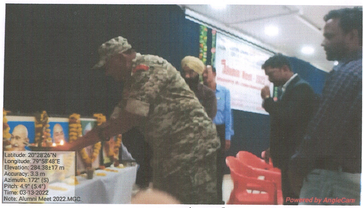
पाहुण्यांच्या हस्ते मालार्पण